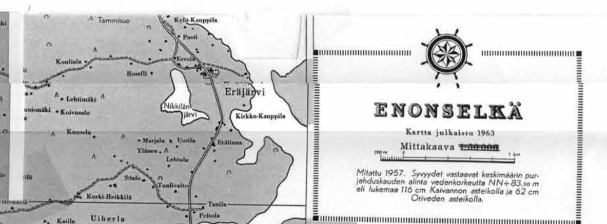
ENONSELKÄ Kartta julkaistu 1963 Mittakaava 1:50000 Mittattu 1957. Syvyudet vastavat keskimäärin purjehduskauden alinta vedenkorkeutta NN+83,0 m eli lukemas 110 cm Käivannon asteikolla ja 62 cm Oiveden asteikolla.